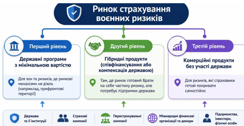
Рис. 1. Ринок страхування воєнних ризиків у межах української моделі, побудовано автором за [3]

та перестраховальних компаній, а також міжнародних фінансових організацій і донорів.