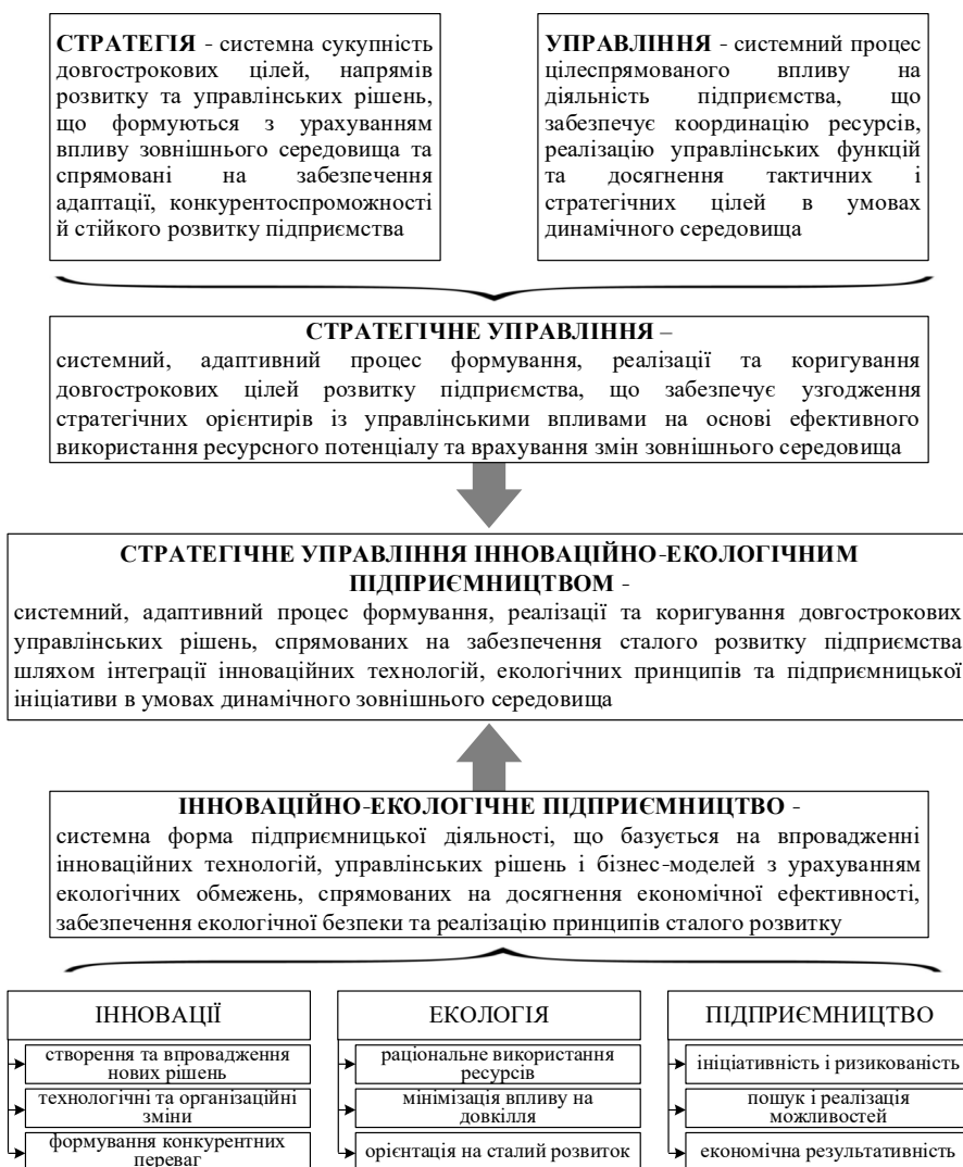
Рис. 3. Понятійний апарат дослідження стратегічного управління інноваційно-екологічним підприємництвом, розроблено автором

Зазначені положення узагальнено у вигляді понятійного апарату дослідження стратегічного управління інноваційно-екологічним підприємництвом (рис. 3).