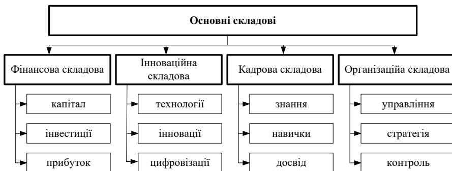
Рис. 1. Складові інноваційно-інвестиційного потенціалу підприємства, розроблено авторами

Інноваційно-інвестиційний потенціал підприємства розглядається як складна багаторівнева система, що охоплює взаємопов'язані ресурси та можливості підприємства. До його складу входять фінансові ресурси, що визначають інвестиційну спроможність підприємства; кадровий потенціал, який формує здатність до генерації та впровадження інновацій; технологічна база, що забезпечує рівень виробничої модернізації; інформаційні ресурси, які підтримують процес прийняття управлінських рішень; а також організаційно-управлінська складова, що забезпечує координацію та ефективність усіх бізнес-процесів. Взаємодія зазначених елементів формує цілісну систему, від рівня розвитку якої залежить здатність підприємства впроваджувати інновації, залучати інвестиції та забезпечувати економічну стійкість і сталий розвиток у довгостроковій перспективі. Основні складові інноваційно-інвестиційного потенціалу підприємства наведено на рис. 1.