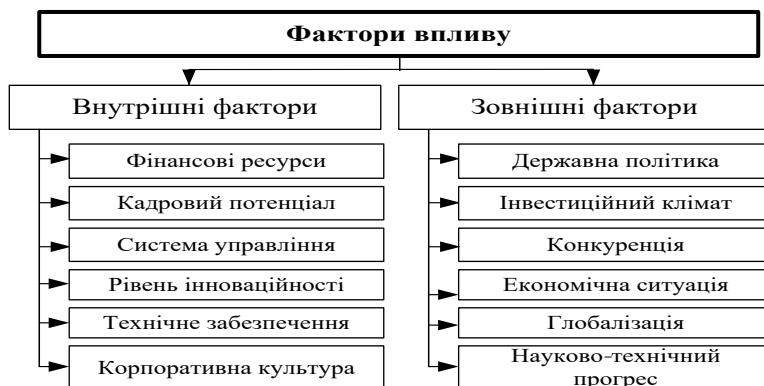
Рис. 2. Фактори впливу на інноваційно-інвестиційний потенціал підприємства, розроблено авторами

більш гнучких, стратегічно орієнтованих моделей управління, які враховують не лише економічні результати, а й екологічні та соціальні аспекти діяльності.