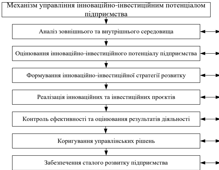
Рис. 3. Механізм управління інноваційно-інвестиційним потенціалом підприємства, розроблено авторами

Ефективна система управління інноваційно-інвестиційним потенціалом повинна забезпечувати раціональне використання наявних ресурсів, підвищення рівня інноваційної активності підприємства, оптимізацію інвестиційних потоків та зміцнення його конкурентних позицій на ринку. Важливим результатом функціонування такої системи є формування стійких передумов для довгострокового економічного зростання, підвищення соціальної відповідальності бізнесу, зменшення екологічного навантаження та забезпечення сталого розвитку підприємства. Механізм управління інноваційно-інвестиційним потенціалом підприємства наведено на рис. 3.