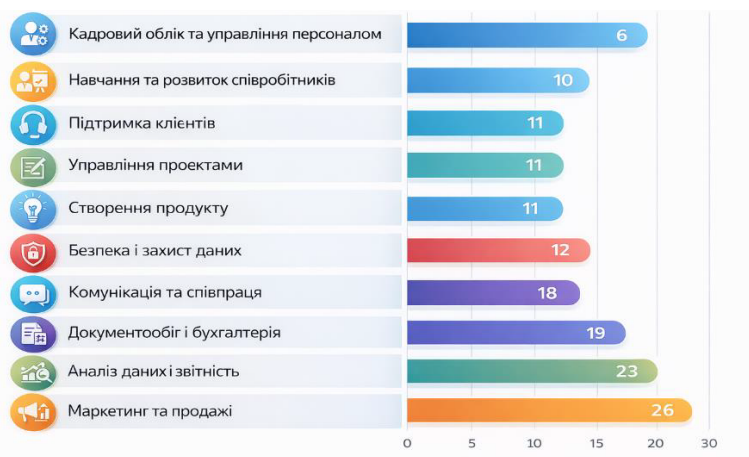
Рис. 2. Потреби бізнесу, для яких використовуються технологічні рішення, згідно результатів дослідження Kyivstar Business Hub [2]

і продажів (26 %) разом із високою часткою аналітики (23 %) вказує на пріоритетність інструментів, що дозволяють підвищити конверсію, точність управлінських рішень і адаптивність до змін попиту. Водночас значні позиції документообігу (19 %) та комунікацій (18 %) свідчать про поступову цифрову формалізацію внутрішніх процесів.