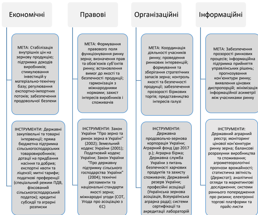
Рис. 1. Класифікація інструментів державного регулювання ринку зерна в Україні, сформовано автором на основі аналізу нормативно-правових актів України [9, 10]

Ефективність механізму державного регулювання ринку зерна значною мірою залежить від чіткого розмежування функцій та повноважень між інституційними суб'єктами, що здійснюють регуляторний вплив на різних рівнях та напрямках ринкової діяльності.