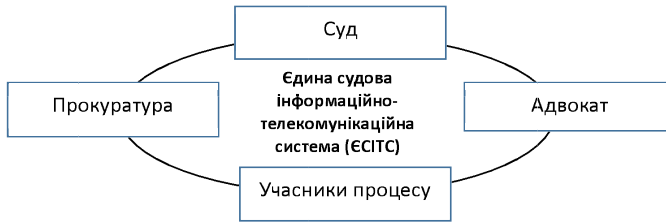
Рис. 1. Архітектура цифрової комунікаційної взаємодії у кримінальному судочинстві, сформовано автором на основі [9; 12; 15]

Посилення комунікаційної взаємодії між судом та учасниками кримінального провадження має здійснюватися на основі комплексного підходу, який поєднує нормативно-правові, організаційні, технологічні та поведінкові складові [3; 9; 12; 14; 18; 20]. Зокрема, важливого значення набуває стандартизація електронних каналів комунікації, удосконалення процедур електронного повідомлення та підтвердження отримання процесуальних документів, забезпечення інформаційної безпеки та захисту персональних даних. Не менш важливим є розвиток комунікативних компетентностей працівників судової системи, прокурорів, адвокатів та інших учасників кримінального провадження, оскільки навіть найбільш досконалі цифрові інструменти не здатні компенсувати дефіцит ефективної професійної взаємодії [1]. Такий підхід дозволяє перейти від фрагментарного використання окремих цифрових інструментів до комплексного управління інформаційними потоками та процесуальними комунікаціями.