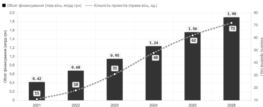
Рис. 1. Динаміка фінансування Фонду декарбонізації України та кількості реалізованих проектів, 2021-2026 рр., побудовано автором на основі [14]

Фінансова архітектура, що підтримує цю трансформацію, базується на значних спеціалізованих механізмах фінансування, зокрема на Фонді декарбонізації України з асигнуваннями у розмірі 1,9 млрд грн на 2026 рік та Фонді інвестицій у відновлення України та США з зобов'язаннями на суму, еквівалентну 1,9 млрд грн. Фонд декарбонізації працює за принципом револьверного механізму і з моменту початку повномасштабної діяльності вже профінансував 72 проекти на загальну суму 1,56 млрд грн, що дозволило досягти щорічної економії енергії понад 132 000 МВт·год та скоротити викиди CO 2 майже на 40 000 тонн на рік у 17 регіонах України [14]. Динаміка фінансування Фонду декарбонізації України та кількості реалізованих проектів наведена на рисунку 1.