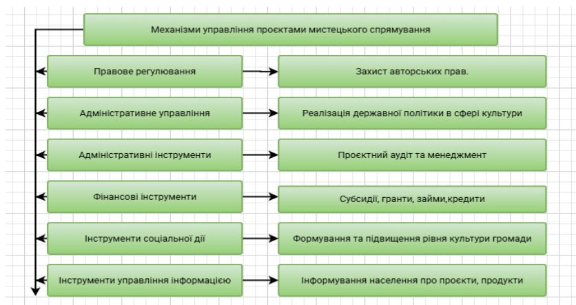
Рис. 1. Складові механізми управління проектами мистецького спрямування, побудовано авторами

До уваги складові механізмів управління проектами мистецького спрямування в схемі, розробленій автором Рис 1.