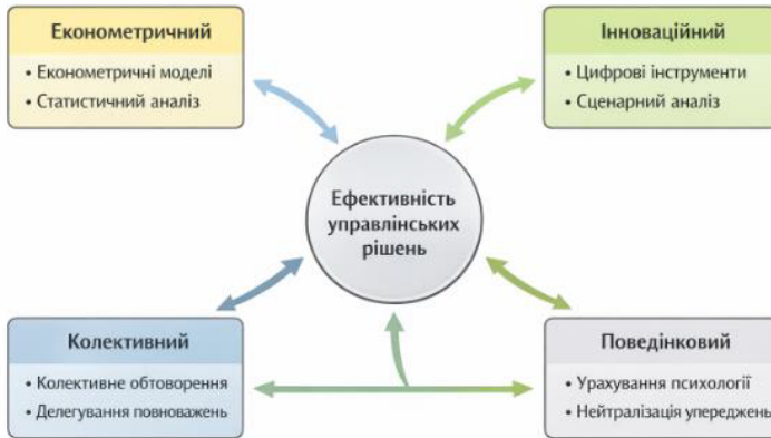
Рис. 2. Взаємозв'язок сучасних підходів до підвищення ефективності управлінських рішень, складено автором на основі [1; 2; 9; 10]

Загальну схему взаємодії сучасних підходів до підвищення результативності управлінських рішень подано на рис, 2, де показано поєднання економетричних, колективних, поведінкових та інноваційних методів у межах цілісної управлінської системи..