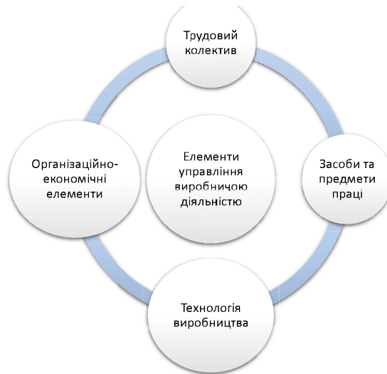
Рис. 1. Елементи управління виробничою діяльністю аграрних підприємств, складено авторами на основі [1]

Казанджі А.В. розглядає процес управління виробничою діяльністю як складну систему, яка об'єднує багато складових елементів. Унаочнимо це на рис. 1. Виокремлення даних елементів дає можливість в подальшому дослідити механізм управління виробничими процесами аграрних підприємств.