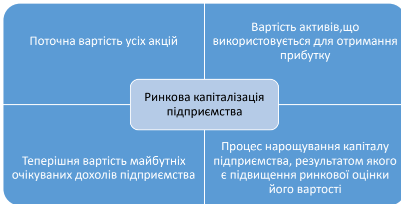
Рис. 2. Визначальні характеристики ринкової капіталізації підприємства, авторська розробка

На підтвердження нашої тези про взаємозв'язок фінансового потенціалу та капіталізації підприємства можуть бути враховані коефіцієнти, які пов'язані з вартістю підприємства. Зокрема, оцінюючи суб'єкт господарювання використовуються показники, які дозволяють порівняти вартість підприємства з його доходами, грошовим потоком, доходом, активами та іншими показниками, що визначають фінансове забезпечення в цілому. Окрім того, поширеними є розрахунок таких коефіцієнтів, що відображають співвідношення прибутку підприємства до сплати відсотків і податків, співвідношення вартості підприємства до прибутку до сплати відсотків, податків, амортизації; вартість підприємства до грошового потоку від операцій; вартість підприємства до вільного грошового потоку та активи.