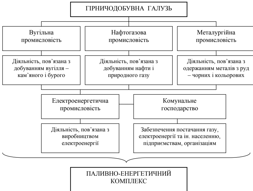
Рис. 2. Основні підгалузі гірничодобувної галузі країни, побудовано автором

Учені звертають увагу на стратегічне значення можливостей розвитку даної галузі, незважаючи на ризики ресурсної залежності від сировинного типу економіки: за умов раціонального використання існуючого природно-ресурсного потенціалу України можна забезпечити конкурентні переваги та надати перспективи для співпраці країни з розвиненими країнами, особливо з тими, природні ресурси яких менш значні або більш вичерпані [5, с. 170]. Гірничодобувна промисловість в економіці країни займає важливе місце, будучи базовою галуззю, яка забезпечує сировинну незалежність України [9, с. 172].