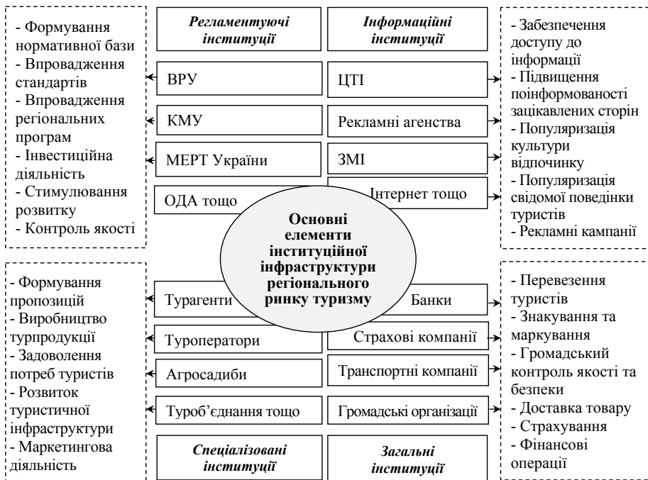
Рис. 4. Інституційна інфраструктура розвитку туристичного ринку на рівні регіону, авторська розробка

Таким чином, інституційне забезпечення процесу ефективного розвитку регіональних туристичних ринків передбачає перегляд деяких його елементів та систематизацію. На нашу думку, сучасний стан інституційної інфраструктури регіональних туристичних ринків в основному сформований чотирма основними елементами (інституціями): регламентуючою, спеціалізованою, інформаційною та загальною (рис. 4).