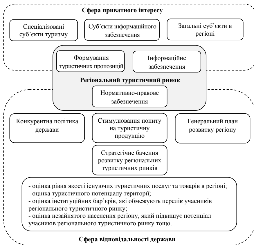
Рис. 1. Розподіл сфер впливу приватного і державного інтересу щодо функціонування регіонального туристичного ринку, авторська розробка

регіону, покращенні фінансово-економічних результатів господарювання туристичних підприємств, що також покращує й економічний потенціал території [4].