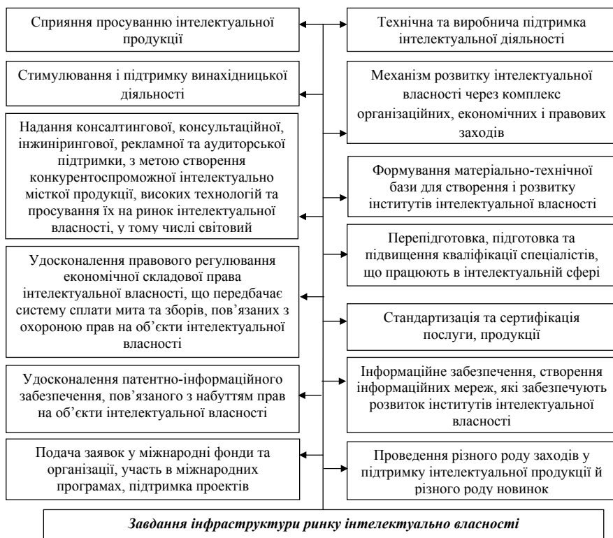
Рис. 1. Деякі завдання інфраструктури ринку інтелектуальної власності, узагальнено автором на основі джерел 10; 11; 9

пропозиції, компонування інтегральних мікросхем, доменні імена, знаки для товарів та послуг, комерційні найменування, наукові відкриття, сорти рослин, породи тварин, комерційна таємниця, ноу-хау.